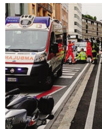
L'incidente in via Mai