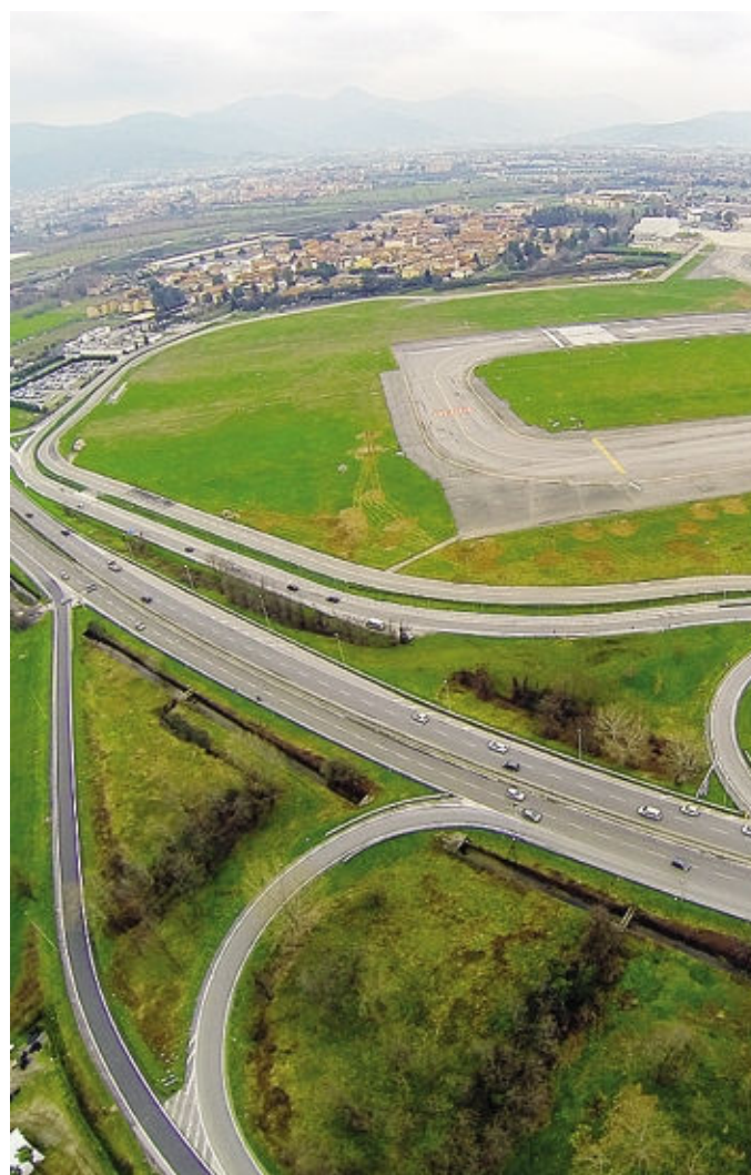
Le aree attorno all'aeroporto dove sorgerà il parcheggio FOTOBORG